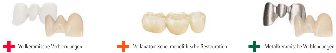
+ Vollkeramische Verblendungen