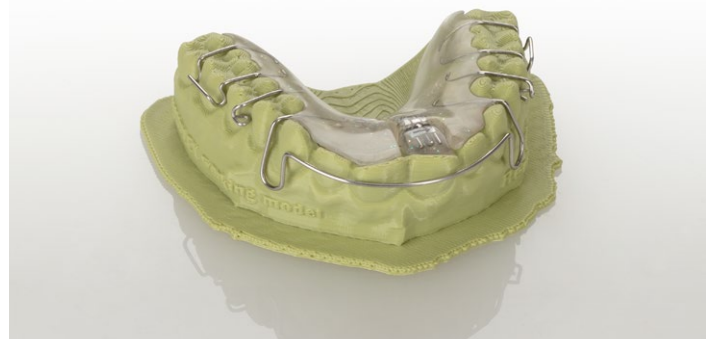
Senza alcun trattamento post-stampa, si può continuare a lavorare con il modello come di consueto