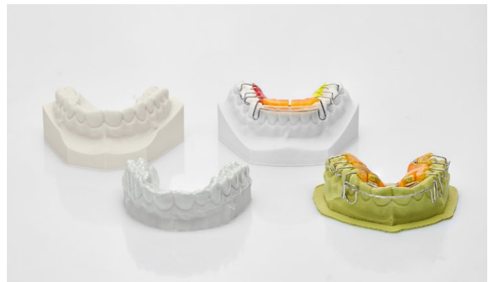
Predisposizione specifica per la realizzazione di tutti i modelli nel settore ortodontico