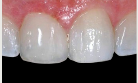
Klinischer Fall, vor und nach der Restauration mit BEAUTIFIL II Enamel