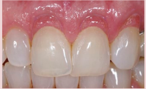
Klinischer Fall, vor und nach der Restauration mit BEAUTIFIL II Gingiva Light Pink